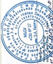
График оценочных процедур МБОУ «СШ №27 им. З.А. Халил» на II полугодие 2024/2025 учебного года (9 классы)